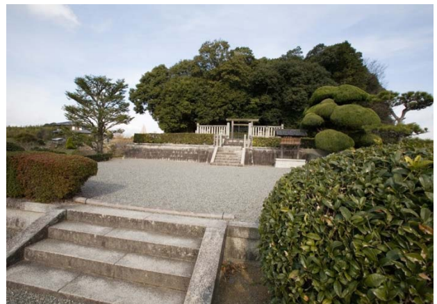
35 天武・持統天皇陵（檜隈大内陵）