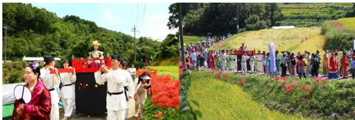
( 持統天皇 吉野行幸の再現 )

このように、飛鳥の女性を語ることから、日本が「国家」として歩み始め、東アジアを通じた世界観が見えてくる。飛鳥時代を牽引したのは女性であった。彼女たちの手によって、政治・宗教・文化の各方面で、我が国の新しい“かたち”が産み出されていった。「日本国」誕生に関わった女性の活躍をみると、世界の中でのこれからの新しい国の“かたち”に、女性の“ちから”が注目される。