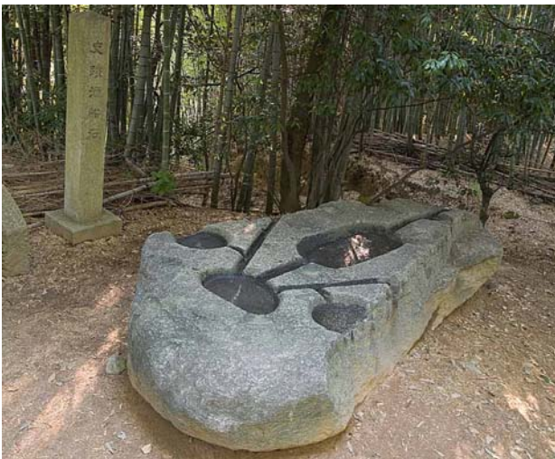
27 酒船石遺跡 (亀形石槽)