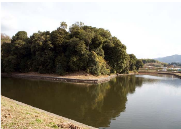
32 欽明天皇陵（檜隈坂合陵）