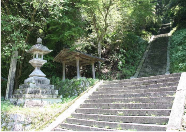
37 飛鳥川上坐宇須多伎比売命神社